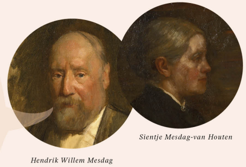
Hendrik Willem Mesdag