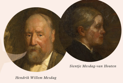
Hendrik Willem Mesdag