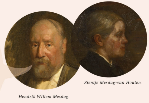
Hendrik Willem Mesdag