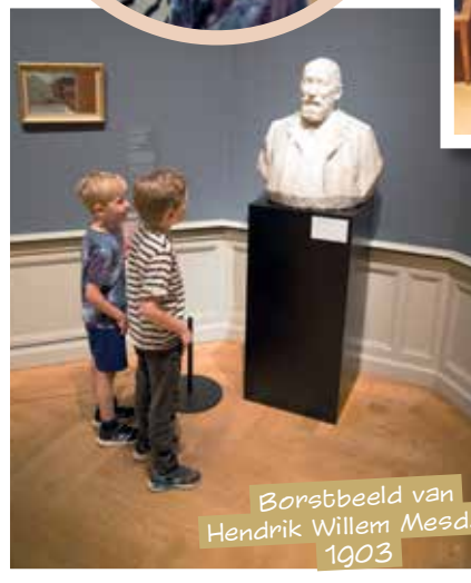
Borstbeeld van Hendrik Willem Mesdag, 1903