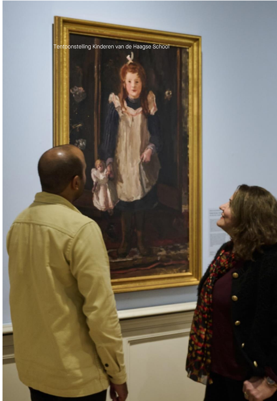
Tentoonstelling Kinderen van de Haagse School