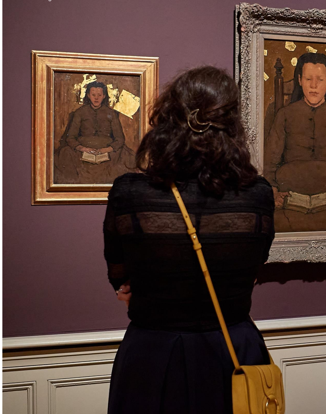
Tentoonstelling Suze Robertson.