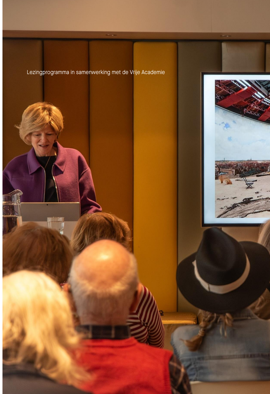
Lezingprogramma in samenwerking met de Vrije Academie